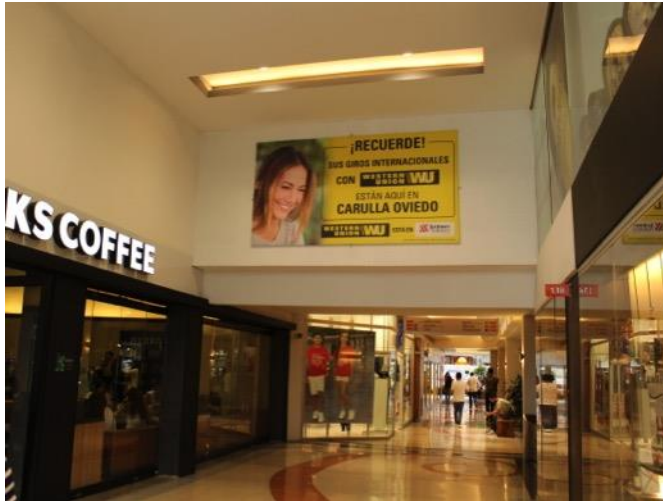
Puente Sector Starbucks