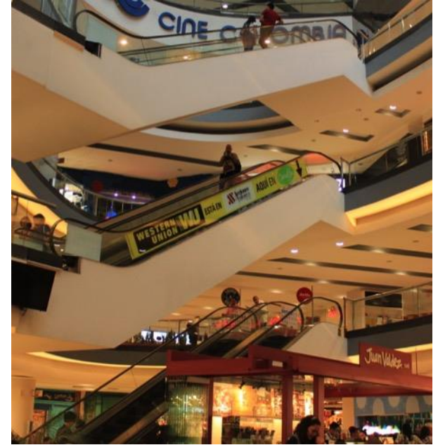
Escaleras Juan Valdez Medida: 716 X 55cm