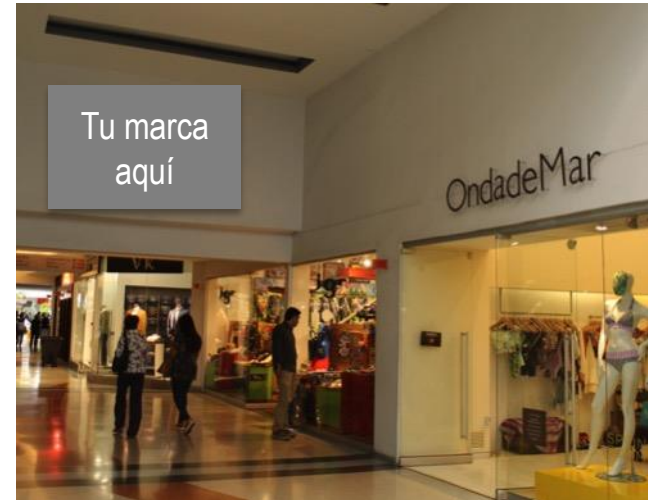
Puente Sector Onda de Mar

*La producción del arte, instalación y desinstalación es asumida por la marca.