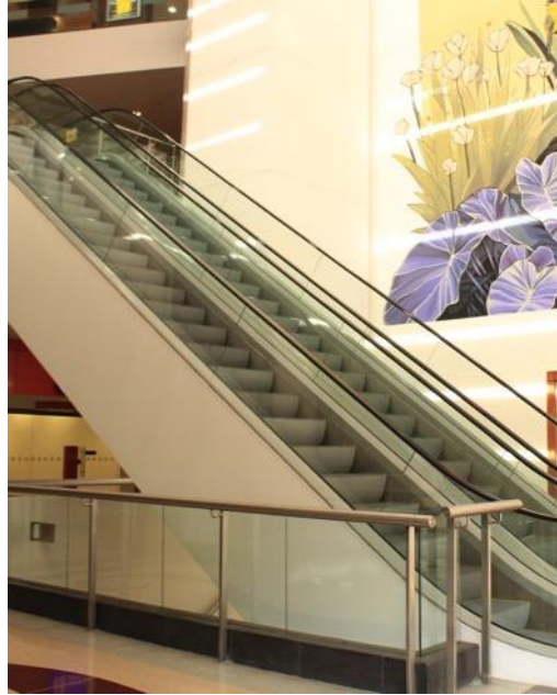
Escaleras Sector Oro 40 Medida: 716 X 55cm