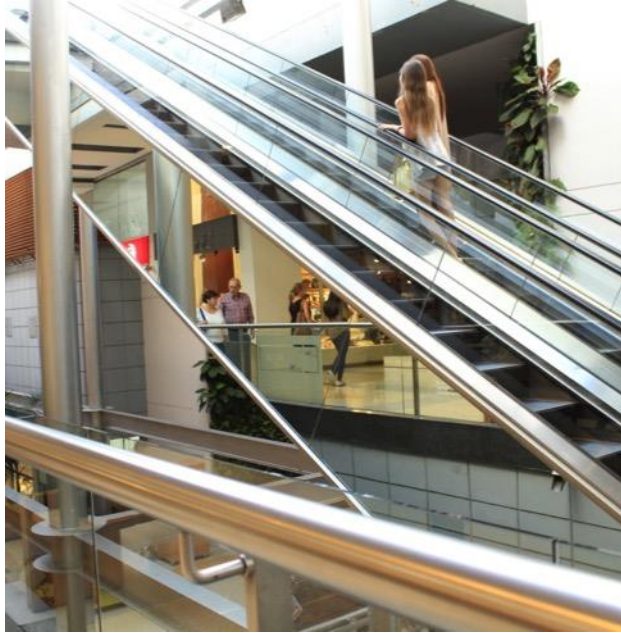
Escaleras Bon Bonite Medida: 12,50 m. X 55cm