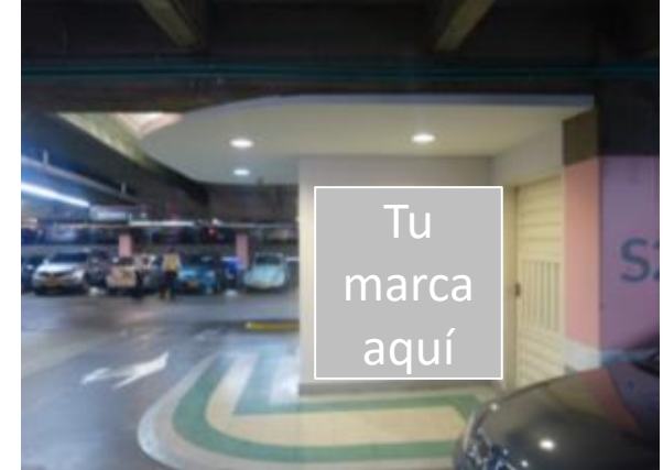
Sótano 2 Medida: 190 x 190 cm