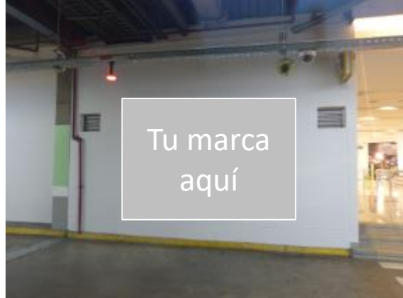
Sector Carulla Sótano 1 Medida: 415 x 270 cm